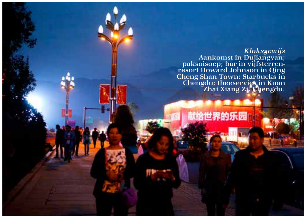
Klosgewijs Aankomst in Dujiangyan; paksoisoepp; bar in vijfsterren- resort Howard Johnson in Qing Cheng Shan Town; Starbucks in Chengdu; theeservies in Kuan Zhai Xiang Zi, Chengdu.

We bezoeken de boeddhistische Wuhou-tempel, waarvan de fundamenten dateren uit de derde eeuw. Binnen het tempelcomplex met lotusvijvers heerst betrekkelijke rust. In de straten buiten de tempelmuren is het een drukte van belang. Bussen, taxi's, personenauto's, scooters: alles wat toeteren kan, toetert. Achter een poort ligt Jinli Li ('Old Street'), vroeger een straat met theehuizen, nu draait het er om street food, zoals varkensneusjes en konijnenkopjes. "Konijnenkopjes met rode peper zijn een delicatessen voor jonge meisjes", zegt Mr. Ye met een pokerface. Hij meent het. We verbazen ons al nergens meer over. Hippe jonge Chinezen met selfiesticks dragen op het hoofd een plastic bloempje op een steeltje. "Al twee jaar een trend", aldus Mr. Ye. We rijden naar het ultraluxueuze winkelgebied Tai Koo Li met topwinkels van Gucci, Versace en Hermès. Zelfs de Starbucks is er mooi. Tai Koo Li ligt aan Dacisi Road, naast de