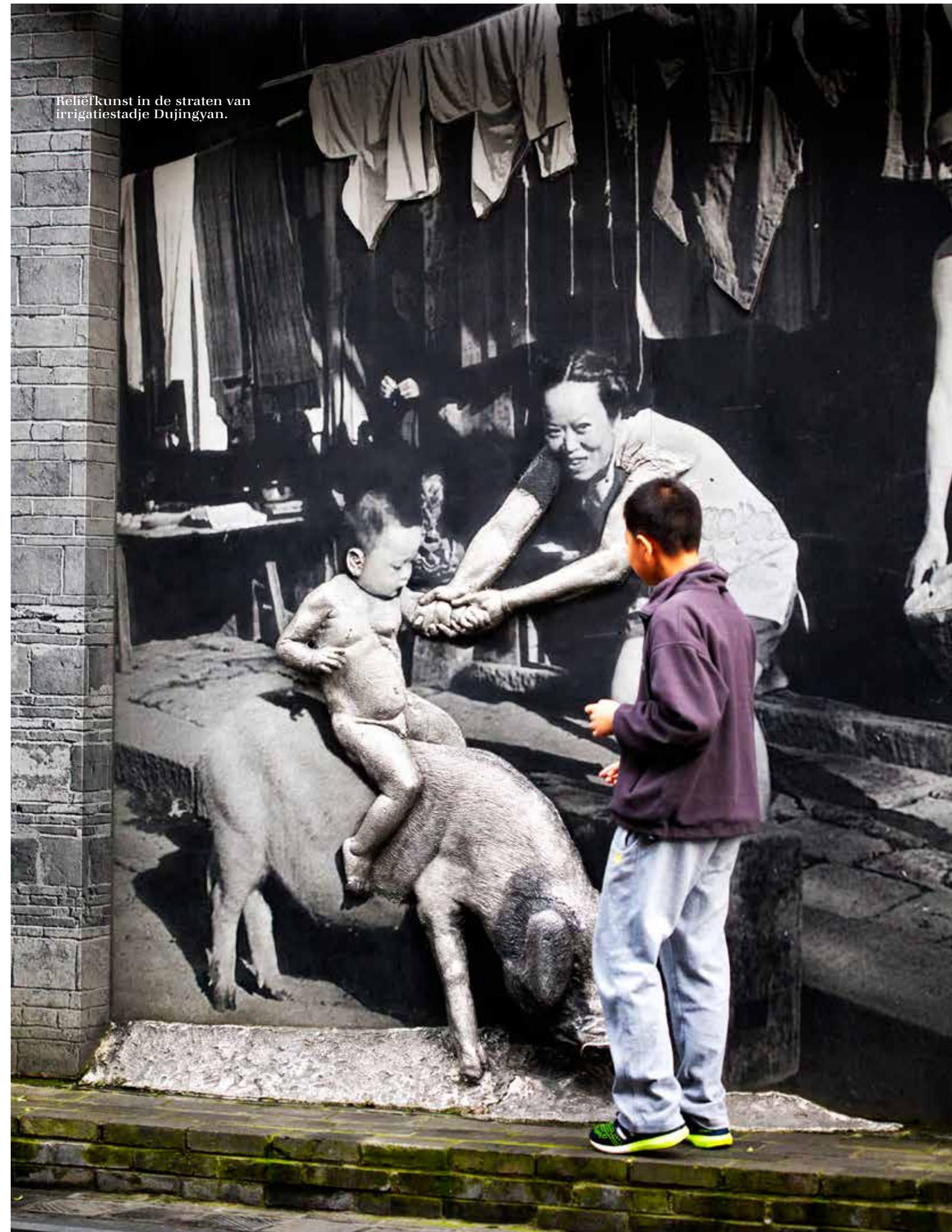
Reliëfkunst in de straten van irrigatiestadje Dujingyan.