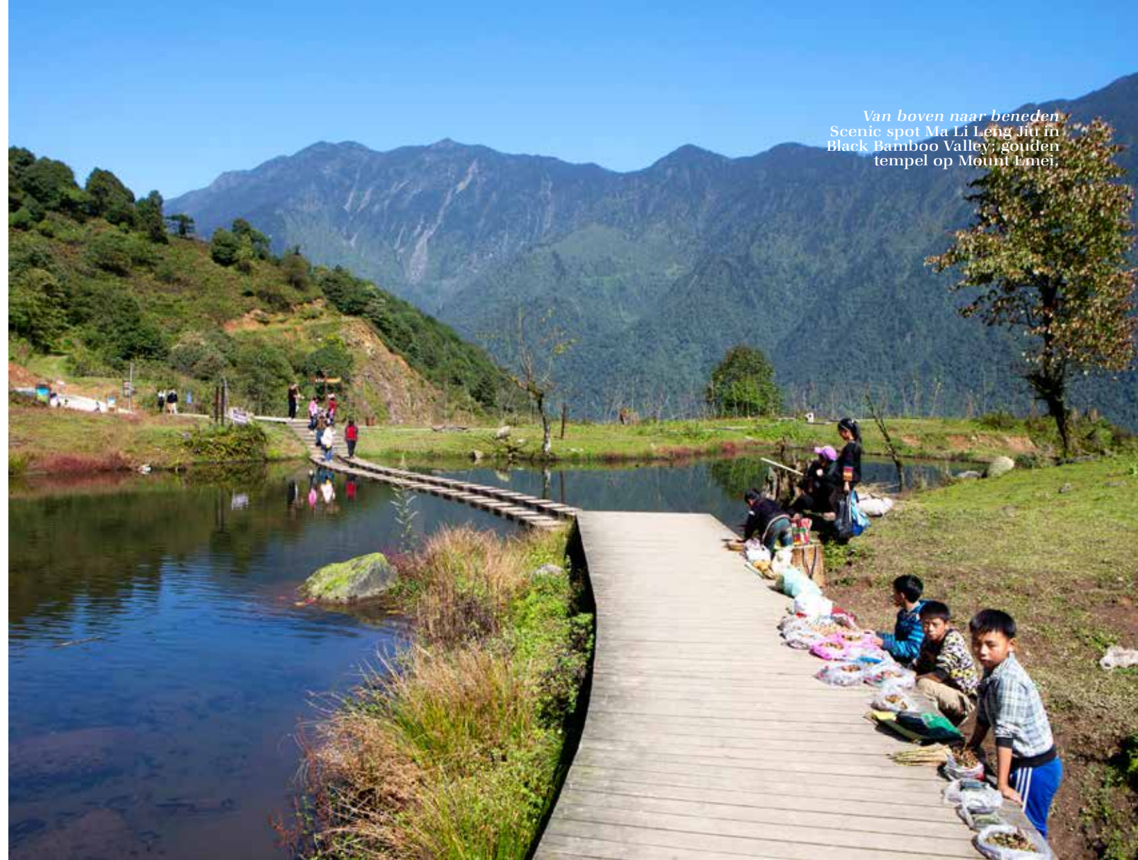
Van boven naar beneden Scenic spot Ma Li Leng Jiu in Black Bamboo Valley; gouden tempel op Mount Emei.