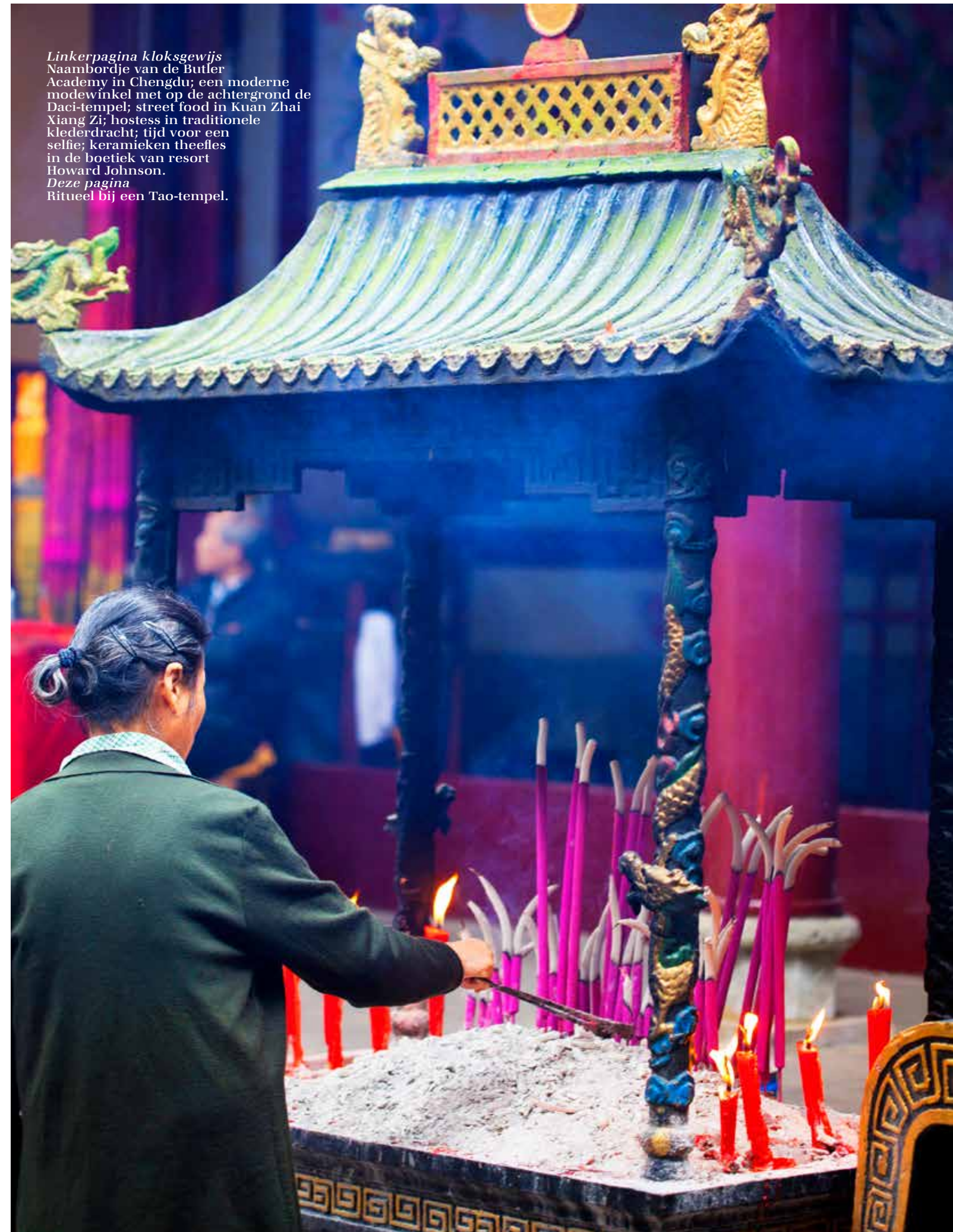
Linkerpagina kloksgewijs Naambordje van de Butler Academy in Chengdu; een moderne modewinkel met op de achtergrond de Daci-tempel; street food in Kuan Zhai Xiang Zi; hostess in traditionele klederdracht; tijd voor een selfie; keramieken theefles in de boetiek van resort Howard Johnson. Deze pagina Ritueel bij een Tao-tempel.