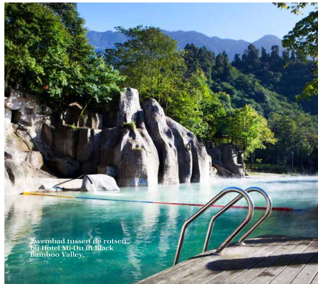
Zwembad tussen de rotsen bij Hotel Mi-Du in Black Bamboo Valley.