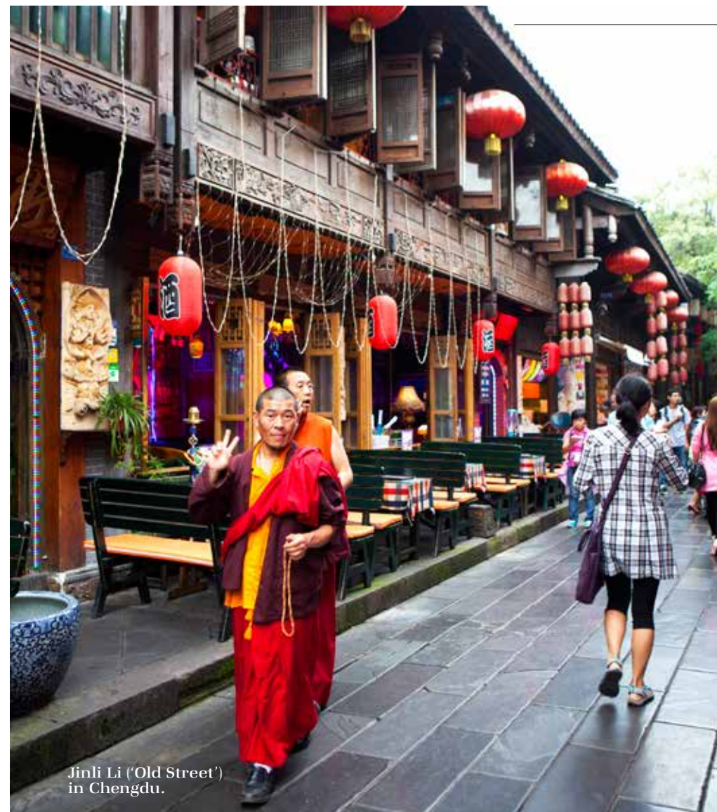
Jimli Li ('Old Street') in Chengdu.